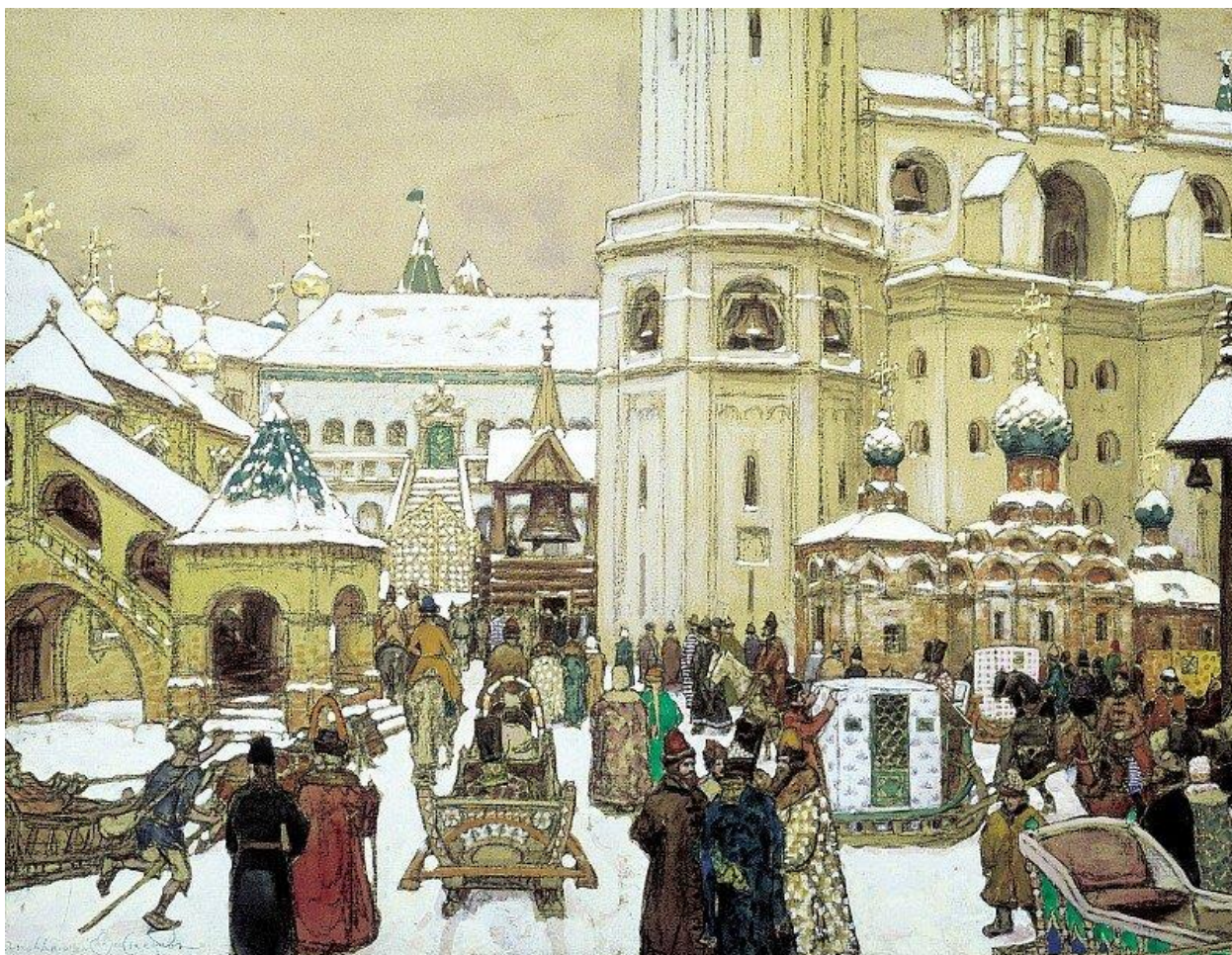
Васнецов А. Площадь Ивана Великого в Кремле. XVII век. 1903 год. Государственный Исторический музей.

А что же со словом «народ»? И здесь все ясно. По самой расцветке этого слова мы можем сразу же понять, чем отличается несравненно высокое слово «народ» от бесцветного слова «массы». Народ создавался из родов и племен, нарождался. Здесь есть корень «род». Произнося слово «народ», я чувствую возрождение. Произнося же слово «массы», я чувствую вырождение, ведь массы – это продукт больших городов, сформировавшийся не под влиянием обычаев, традиций, унаследованных от предков, а под теми воздействиями (печать, кинематограф, радио, телевидение, интернет), которые не считаются с прошлым, не уважают традиции рода, не знают и не хотят знать своей родословной. Массы – это Иваны, не помнящие родства.