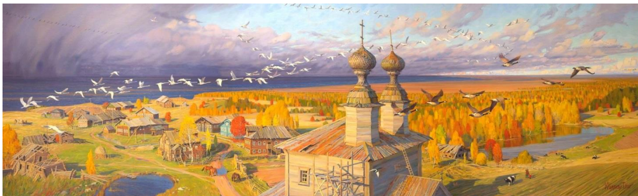
Картина Татьяны Юшмановой. Тот самый храм преподобных Зосимы и Савватия Соловецких, с которого все началось.

Русская культура — это жизнь убогая С вечными надеждами, с замками во сне. Русская культура — это очень многое, Что не обретаётся ни в одной стране.