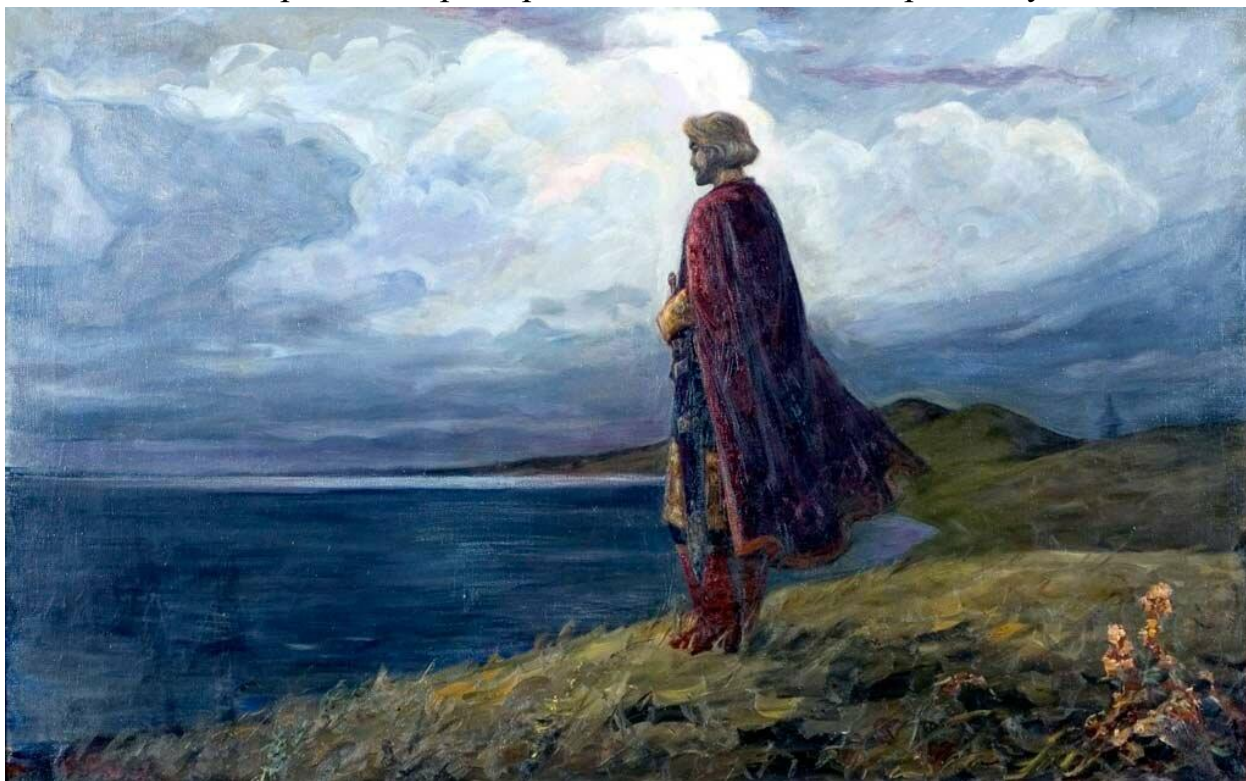
Рубцов С.С. Александр Невский на Плещеевском озере.

С приходом к власти большевиков был уничтожен цвет российской нации, искоренили лучших из русских людей, а многие покинули Россию и свои великие таланты реализовывали на чужой земле. Много лет подряд наш народ отучали думать, принимать самостоятельные решения, иметь свои суждения и особенно ярко это проявляется в наши дни, когда людей просто зомбируют информацией, оболванивают. Народ находится как бы в состоянии беспамятства. Чтобы повести такой народ по пути возрождения, необходима воспитывающая авторитарная власть, имеющая национально-патриотическую основу. Необходима сильная личность, способная к решительному и быстрому принятию решений. Дискуссия в такой ситуации лишь растрчивает время и помогает упускать возможности, а коллегиальность предполагает многоволие, несогласие, безволие и уход от ответственности. Происходящее сегодня разложение и гниение нашего общества может остановить делающий ставку на духовную силу и качество спасаемого народа единоличный диктатор, который сможет открыть дорогу качеству и таланту, уму, честности, верности, творческой способности, храбрости, совестливости, воле. Такой национальный диктатор должен повести Россию по дороге, которая приведет ее к величию и расцвету.